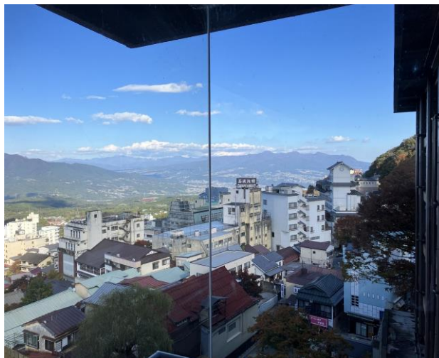
<伊香保温泉の風景②>