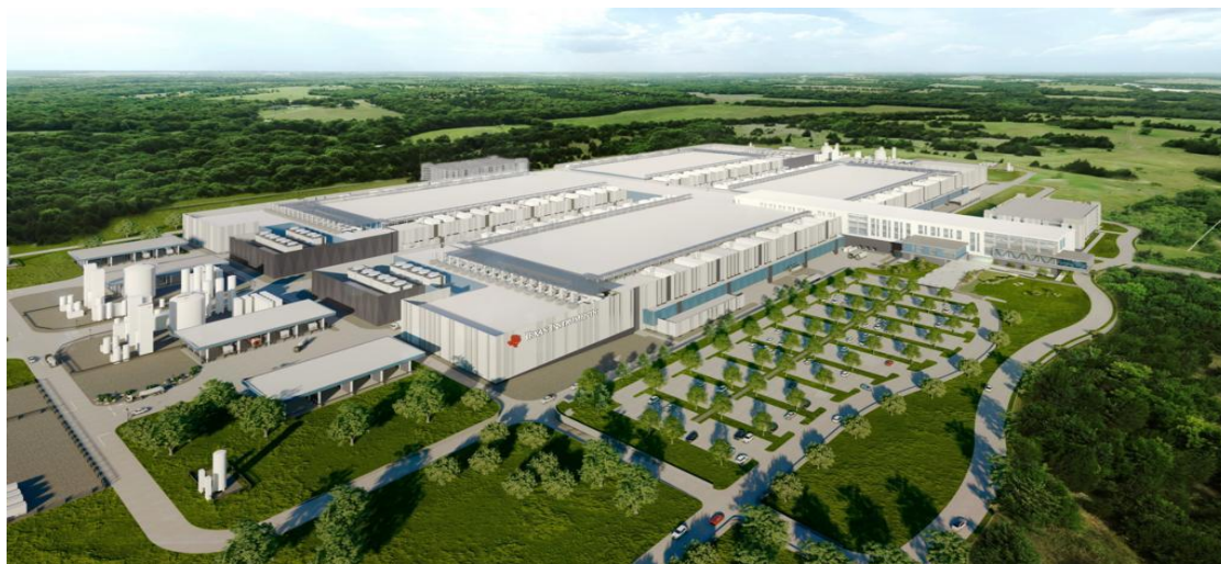
TSMC 熊本工場 JASM (tsmc Fab23) 熊本県菊陽町

Cは、日本の熊本工場の建設の進捗は、米国・アリゾナ州の新工場よりも大幅に進んでいる。国の支援のもと、先端半導体の国産化を目指す「Rapidus（ラピダス）」は、北海道千歳市に建設する新工場の起工式を行い、4年後の量産化に向けて本格的に始動しています。大変に将来性のある明るい話題です。ウチヤ社もこの生産設備や検査装置へのハイブリッド・サーモスタットの搭載を進めています。