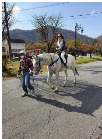
<榛名湖周辺 (写真は渡辺製作所の麗文社長)>