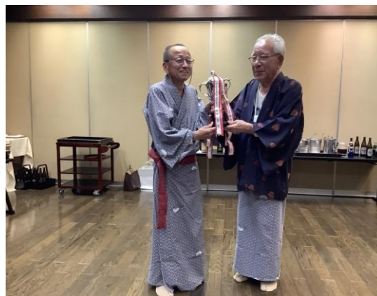
<ゴルフ会で宮原会長が優勝>