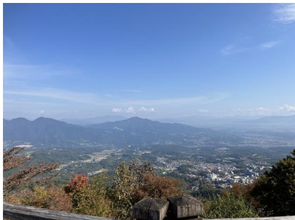
<榛名山から伊香保温泉を見下ろした風景>

翌日は朝食後に現地解散、時間のある方々は、ケーブルカー、群馬富士榛名山等を見学、伊香保グリーン牧場にて昼食を堪能し、無事秋のウチャ共栄会は終了となりました。何分久々の秋のウチャ共栄会開催となり、ウチャ側の至らぬ点が多々有ったものと感じております。この反省点を今後のより良いウチャ共栄会開催に活かしてゆきたいと考えております。ありがとうございました。