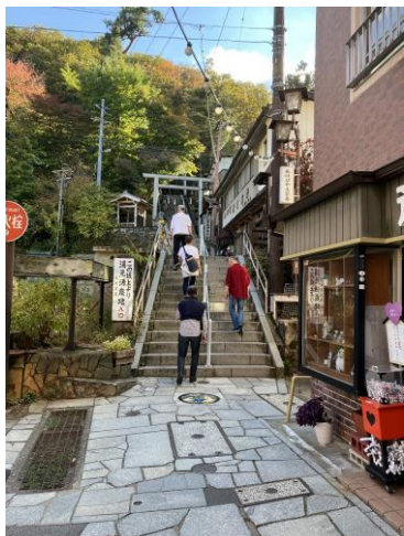
<伊香保温泉の風景①>

また、ゴルフをされない皆様は、三々五々、ウチャ共栄会開催会場であります伊香保温泉岸権旅館に來場されました。