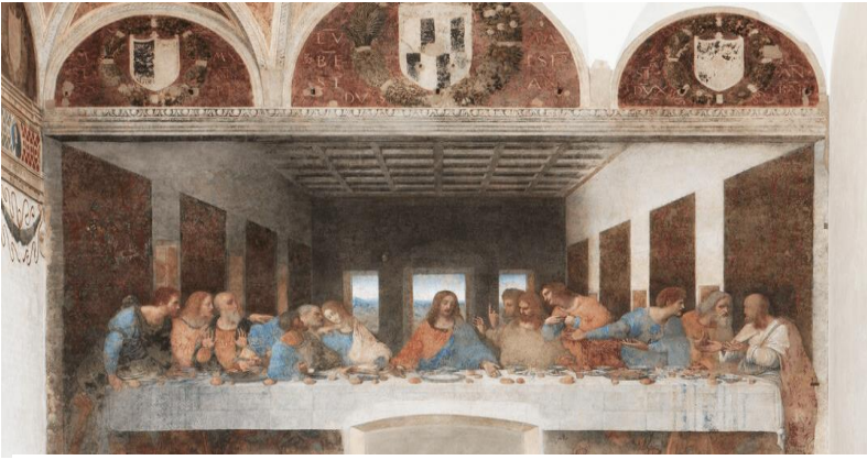
キリストの最後の晩餐

古代イスラエルを制服したローマ帝国は、紀元前 753 年 4 月 21 日に都市国家として建国され、その後次第に支配地域を拡張、一部（東ローマ）は 1453 年まで、実に 2000 年以上にわたって存続。特に帝政ローマの時代は、地中海を中心に西ヨーロッパから黒海沿岸、中東、北アフリカまでを支配し、帝国の記憶・古典文化・キリスト教はその後のヨーロッパ社会の土台となっています。