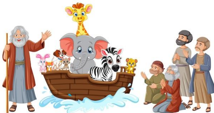
旧約聖書(ユダヤ教)のノアの方舟

しかし、アラブ側(パレスチナ)は強硬に反対し中東戦争が勃発し、それは1973年の第四次まで続きました。その後、イスラエルはエジプトやヨルダンと平和条約を結びましたが、中東戦争で獲得したゴラン高原の占領を続けています。1993年には、パレスチナ自治区(ガザ地区、ヨルダン川西岸)の暫定自治について、パレスチナ解放機構(パレスチナ暫定自治政府)と合意しましたが(オスロ合意)、その後も双方の衝突は続き、事実上オスロ合意は崩壊。イスラエル軍による空爆や、パレスチナ過激派組織によるテロが頻発、そして今回の戦争に至っています。