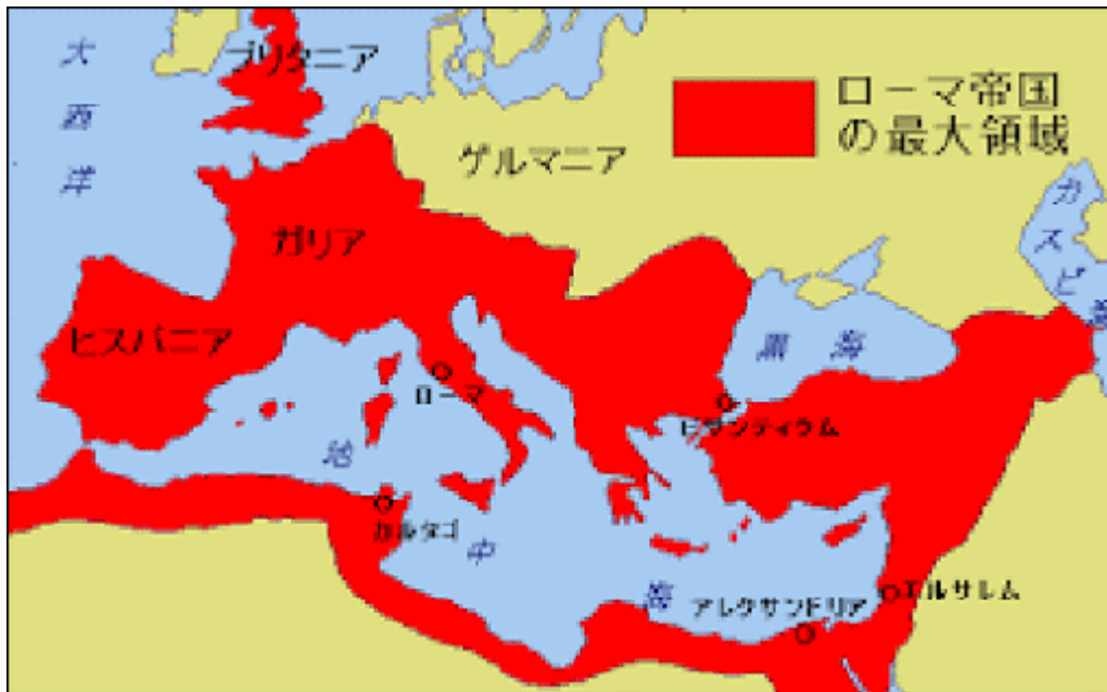
ローマ帝国の最大支配地域

ローマにとっては辺境と言えるパレスティナ地方でユダヤ教から生まれたキリスト教は、度々迫害を受けながらも信者を増やし、4 世紀末には遂にローマ帝国の国教とされるに至っております。これは、ヨーロッパ世界がキリスト教文化圏となる大きな契機ともなったとされています。