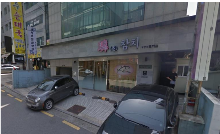
<DOHAN 社と行った日本料理屋>

帰国前日にはソウル市にあるウチヤの韓国代理店の DOHAN 社を訪問しました。DOHAN 社は古びたオフィスビルの一角に居を構えており、小さな看板を見落とせば、通り過ぎてしまいそうです。