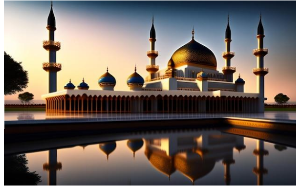
イスラム教 モスク(礼拝堂)

だと考えられています。ユダヤ教徒やキリスト教徒が神の言葉を正しく守っていなかったため、最後の預言者として神がムハンマドを選んだとされています。