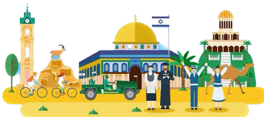
1947年に今のイスラエル国の独立

さて、今回はこのイスラエルとパレスチナの問題に関して、歴史的に難しい経緯が何千年に渡ってあり、奥が深くその背景を考察することは大変に難儀なことで簡単に理解出来る経緯ではありませんが、一度は興味を持って把握しておく必要があると思います、下記に纏めて見ましたので参考にして下さい。